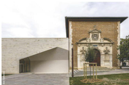
Rénovation du musée des Augustins, Toulouse / Aires Mateus

Traditionnellement dédiés à la conservation des œuvres et à leur diffusion au public, les musées voient