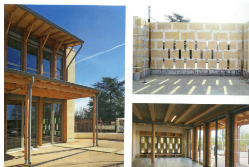
Rénovation-extension école (Montfermeil, 93) / Atelier d'architecture Bien urbain

seulement de remplacer le béton ou l'acier, mais de savoir quel modèle productif ces matériaux installent.