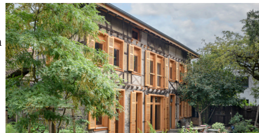
Maison C, Kub Architecture & Design, Strasbourg 2022

support d'une expressivité architecturale totalement renouvelée.