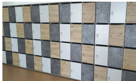
Meuble transformé et réemployé pour la salle des professeurs, collège de Castelnau d'Estrétefonds

Un marché d'expérimentation a permis de réaliser le sourcing, l'étude financière et des prototypes. Puis, le marché d'innovation a été lancé.