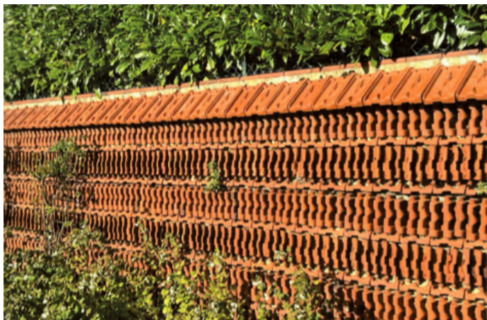
Remploi de tuiles pour un mur de clôture

Pratique ancestrale, avant tout pour des raisons de coût et de proximité, le remploi s'impose de plus en plus ces dernières années. Un bâtiment donne ainsi naissance à un autre édifice ou le complète, selon les besoins. Ce dossier évoque le lien indissociable entre remploi et l'architecture vernaculaire, jamais figée, qui évolue avec son territoire et participe, en miroir à l'identité de celui-ci.